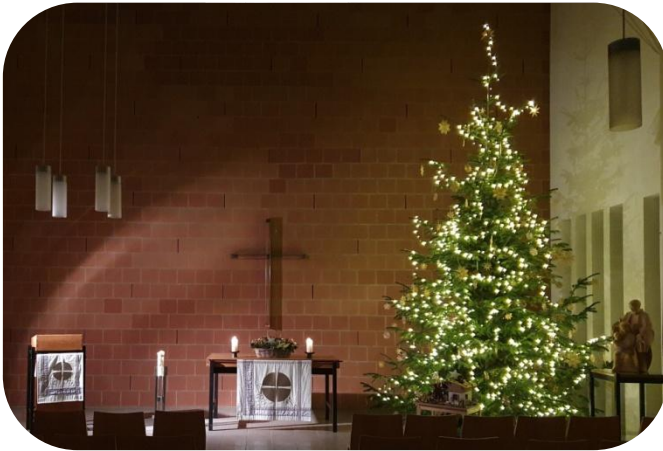
Weihnachten in Moosburg