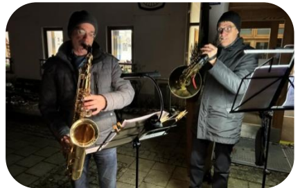
Bläserduo nach der Christmette in Moosburg