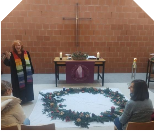
Weihnachten: Spontanes Krippenspiel in Wartenberg